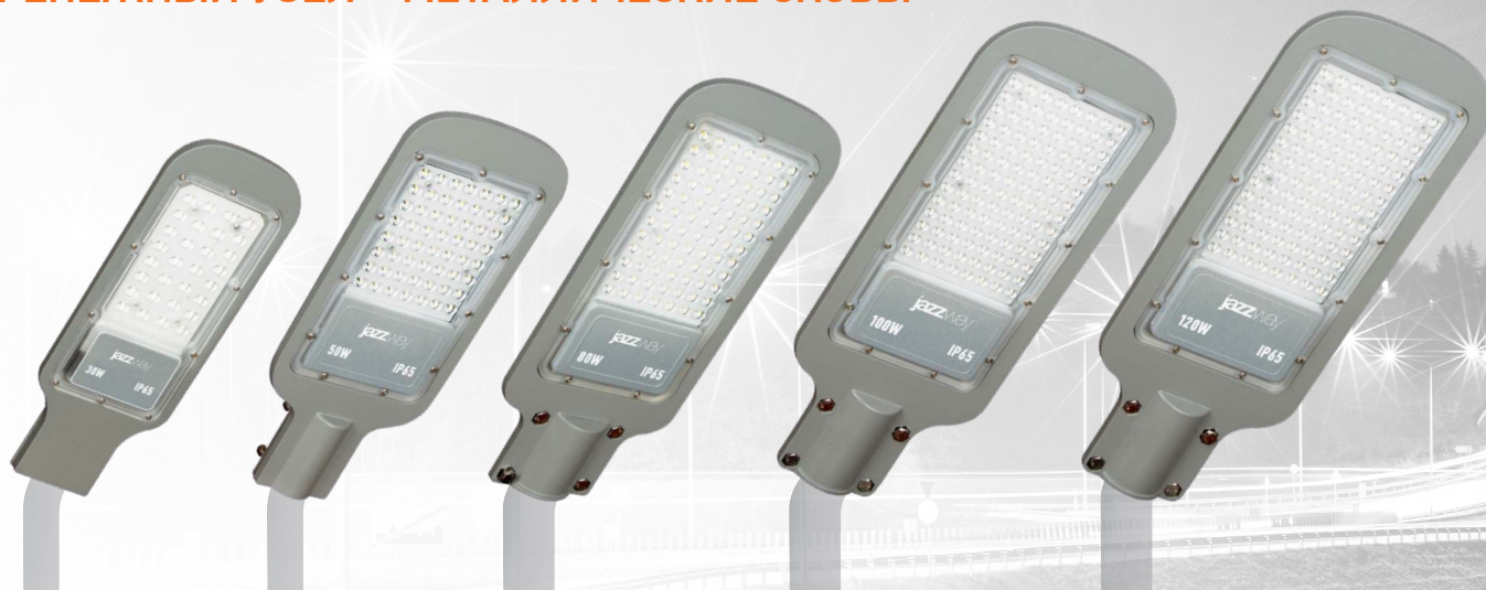
PSL 07 30w