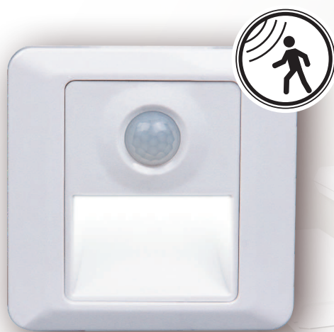
PWS/R S8686 2w