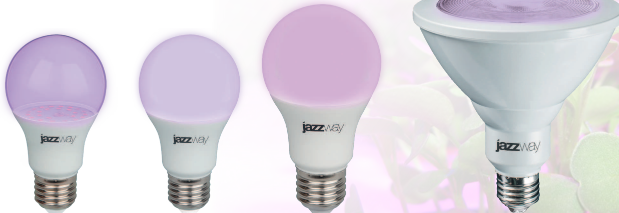
PPG A60 AGRO Clear