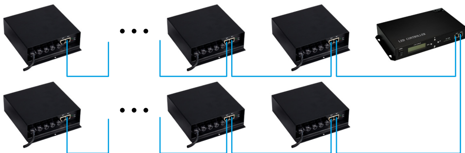
Рис 2. Slave-контроллеры подключаются к двум портам Master-контроллера.