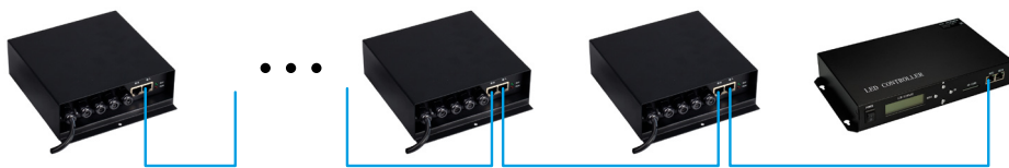
Рис 1. Все Slave-контроллеры подключаются к одному порту Master-контроллера.