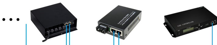
Рис 3. Использование оптоволоконного кабеля и медиаконвертеров для увеличения дистанции передачи сигнала.

3.6. Вставьте карту памяти в контроллер. Включите питание и проверьте работу контроллера. Контроллер воспроизводит файлы в алфавитном порядке.